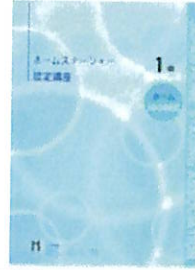
1級認定講座テキスト【ホーム】