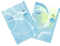
1級認定講座テキスト