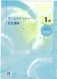
1級認定講座テキスト【ライフ】