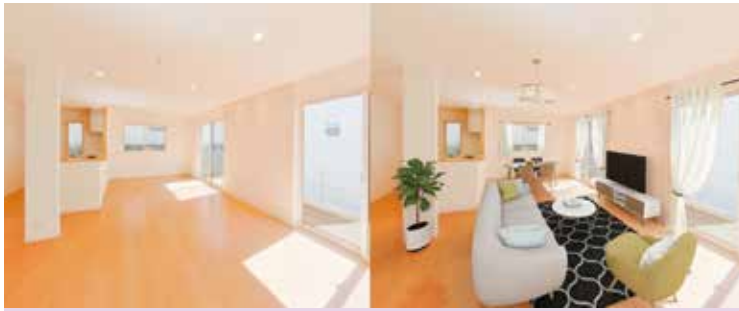
VRステージング https://www.theta360.biz/services/vrstaging/ 家具小物などのインテリアはCGを使ってまるで本物のように表現している

特に不動産業界での営業手法は非接触型を取り入れる会社が増えてきています。例えば、空室物件にVRホームステージング(CG家具・小物をコーディネート)を導入することで、コンピュータを使って本物そっくりに描かれた家具小物で、魅力的に演出することが