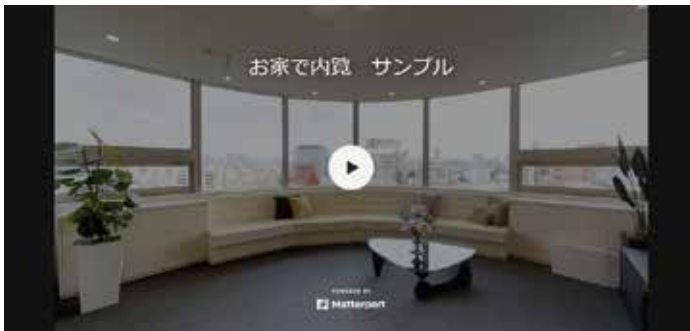
3Dカメラ(米国Matterport(マターポート)社)で撮影した3Dウォークスルー動画 自宅にいながらあらゆる角度から物件を内見をしているような疑似体験ができる。

できるようにになりました。内見者は実際に物件に足を運ぶことなく、ウェブで好印象の部屋を見ることが出来ます。また、空室物件に、実際の家具や小物をホームステージング後に、3Dカメラ(米国Matterport(マターポート)社)で撮影した3Dウォークスルー動画を導入している物件も多くなってきました。これは、クローゼットの中や棚の中まで、開けて見ることができ、まるで自分自身が実際にドアを開けて、部屋の中を自由に内見しているような体験ができます。また、営業スタッフだけが物件の部屋に入り、内見者は自宅でオンライン経由で物件内部の画面を共有しながら営業スタッフとリアルタイムに会話しながら内見ができるサービスも始まりました。