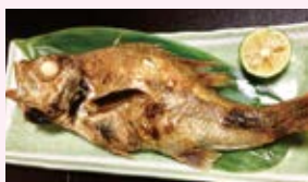
米子駅前の居酒屋で食べた、ノドグロ

吉塚 092-271-0700 http://yoshizukaunagi.com/ 〒810-0801 福岡市博多区中洲2丁目8番27号