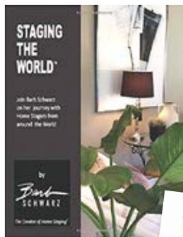
バーブ・シュワルツ氏が執筆した「ホームステージングワールド」日本版ホームステージング体系化の背景と事例が掲載されている

エネルギーシナジーな講義は、若いころ女優をしていたという彼女の表情豊かな表現は、聴講している受講者みんなの心を打つものでした。