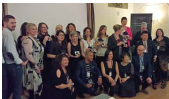
2018.4.23 ホームステージングプロフェッショナル国際協会® (IAHSP) ヨーロッパ大会