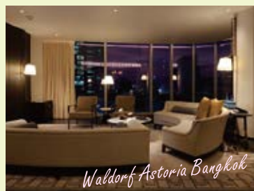
バンコク【ウォルドーフアストリア バンコク】

2つ目はバンコクの【ウォルドーフアストリア バンコク】です。バンコクのホテルは施工やディティールが粗い感じがありましたがこの施工は精巧にできておりマニアも満足です。