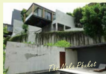
プーケット【ザ ナカ プーケット】

協会理事でホームステージャー認定資格インテリア担当の鶴沼講師は海外旅行が趣味です。本日は非日常を味わえるラグジュアリーな気分が味わえるホテルを2つ紹介してもらいました。