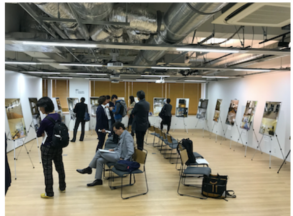
応募者のほか、不動産や流通関連企業の方、一般の方が来場しました。

「今回のコンテストで特に顕著だったのは、男性の入居者を意識したようなホームステージングが出てきたことです。これまでは女性やファミリーに親しまれやすい、明るめなインテリアがほとんどでした。それは女性が物件を選ぶときのキーパーソンであるからです。しかし今回は陰影があったり、黒っぽい色や濃い色を使うなど、男性が好みそうなインテリアの作品が多かったのです。このことは、これまでのような女性目線を意識したインテリアだけでなく、もっと多くのターゲットに向けてのホームステージングが広がってきていることのあらわれではないかと思えます。今後は、さらにこれでは物足りなくなり、もっと個性を求めるようなホームステージングの事例が出てくるのではと期待しています」